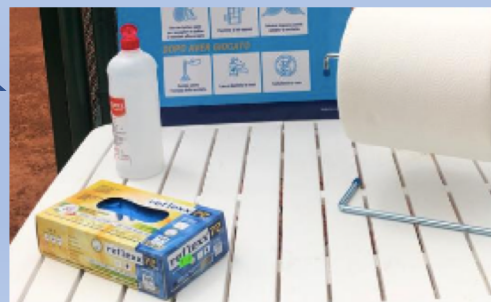
7) Punto di sanificazione al cambio campo