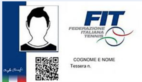
1) Controllo tessera FIT e certificato medico