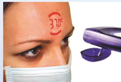
2) Controllo temperatura