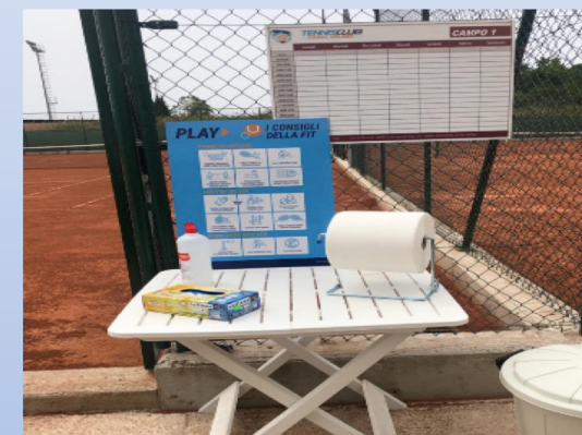
4) Punto di sanificazione ingresso campi