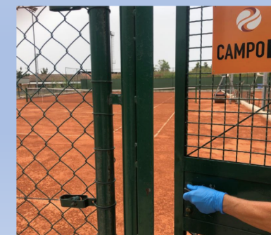
5) Uso guanti apertura e chiusura