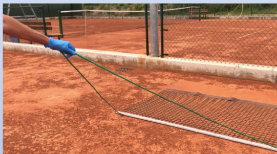
8) Uso guanti per stuoia